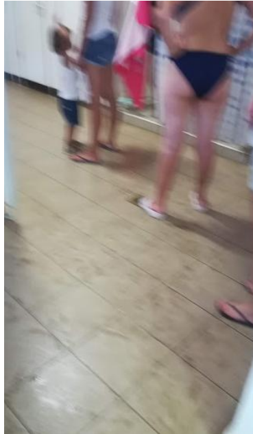
3. sz. kép

Az első vizesblokk női részén a víz elfolyás nem működik. Minden egyes zuhanyzás után áll a víz. De nem csak a zuhanyzás után hanem ezt tapasztaltuk az esti takarítás utáni reggeli nyitás során is, hogy áll a víz ezen a részen. Értem ez alatt, hogy szivárog a víz valahonnan.