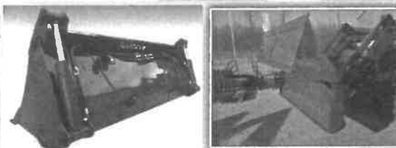
Kép tájékoztató jellegű