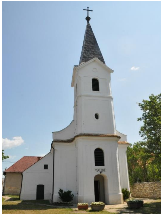
1. ábra 1827-ben a középkori templom alapjaira felépül a templom

1824-ben a piarista rend elkezdte a templom építését.