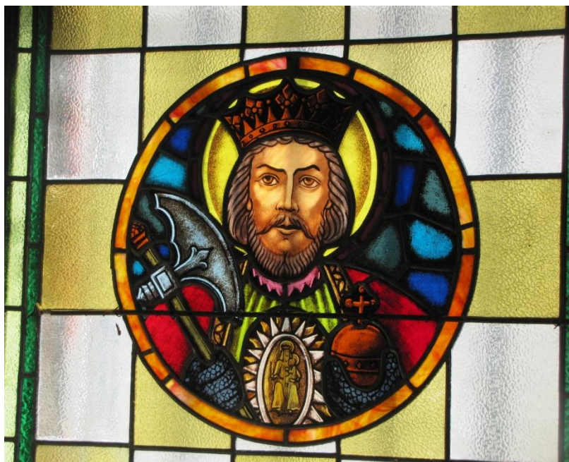
13. ábra Szent László lovagkirály