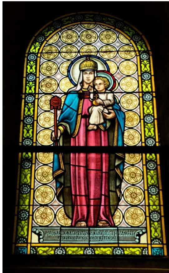
11. ábra Szűz Mária, hazánk oltalmazója