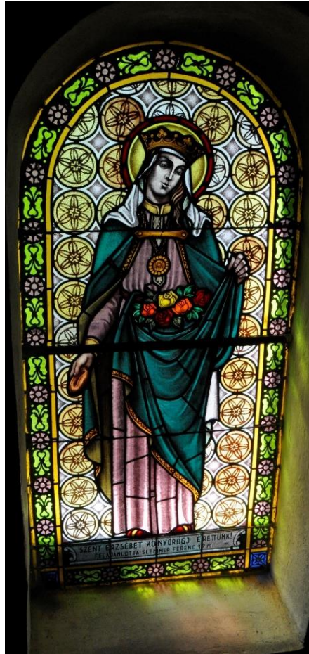
12. ábra Szent Erzsébet