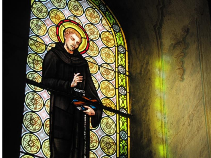
10. ábra Szent Ferenc