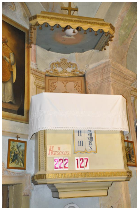
3. ábra Késő copf, kora klasszicista szószék, baldachin tetejének belső felén háromszögben megjelenő Isten szeme ábrázolással