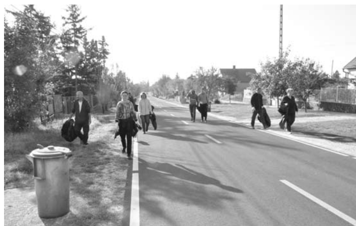
A megtisztított erdők, mezők üzenik: köszönjük lelkes szemétszedők! A képen a csapat egy része