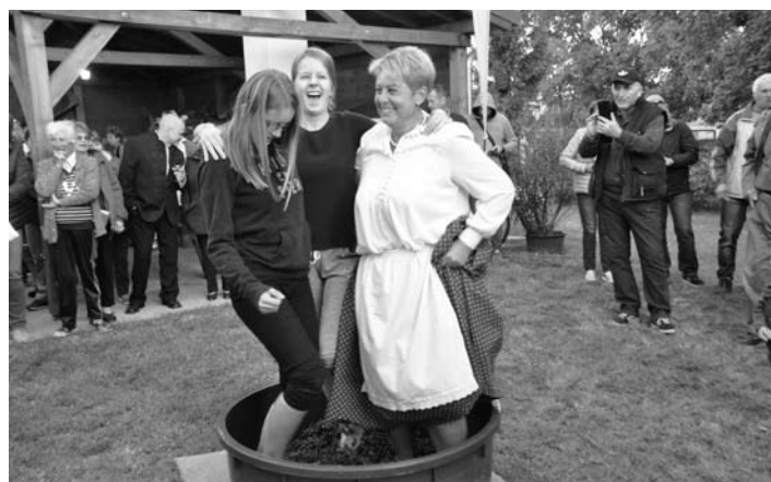
A fiatal hölgyek által taposott must íze semmi mással össze nem hasonlítható