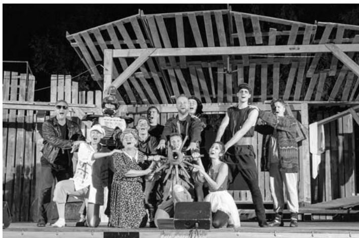
Újabb remek előadást láthattunk a Szabadtéri Színpadon