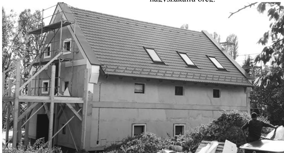
A Mag-Tár-Ház felújítása jól halad...

17,00 óra Polgármesteri Hivatal nagyterme. A Balatonakali Erdélyi Kör egyesület szervezésében könyvbemutatóra kerül sor a Polgármesteri Hivatal nagytermében.