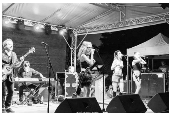
Marót Vikiék remek koncertet adtak