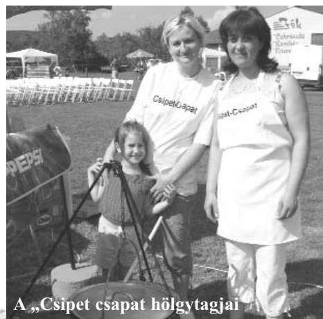
A „Csipet csapat” hölgytagjai