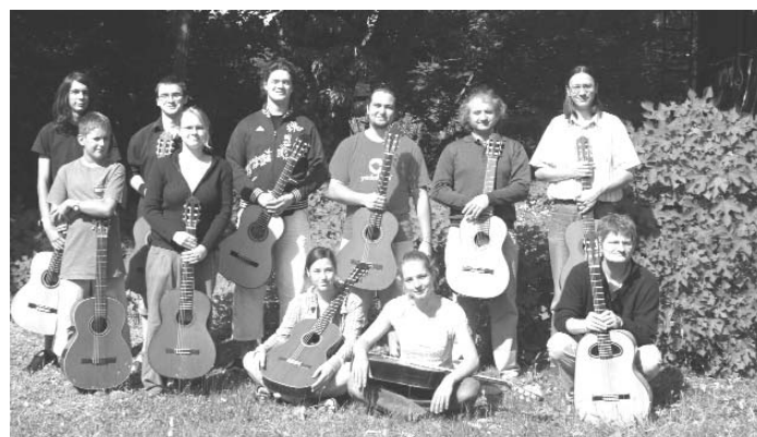
Mester és tanítványai