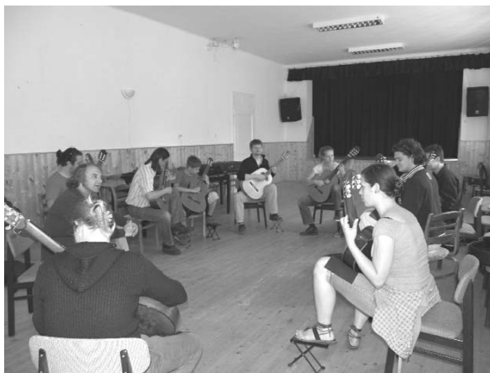
Délelőtti tanítás a Művelődési Házban