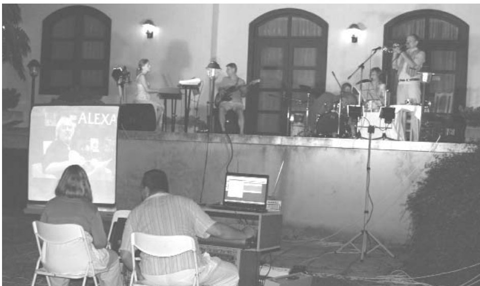
Pillanatkép a műsorból

nyüzenei élmény ezen a kellemes nyári esten a polgármesteri hivatal udvarán, amely ezúttal is ideális előadótérnek bizonyult.