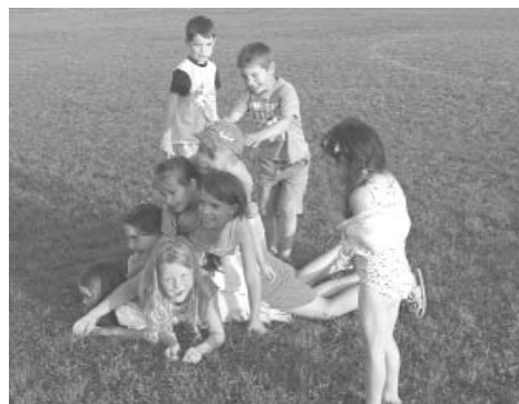
Vidám „gyermekgúla” a sportpályán