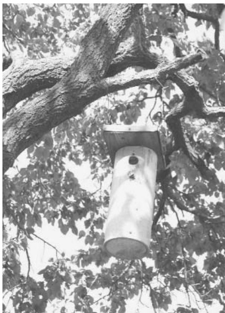
A házilag elkészíthető odú

– Hogyan tud legegyszerűbben odút készíteni az, aki szeretne segíteni a madarakon?