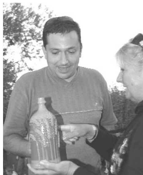
A „Kokó hal” képviselője átveszi az első díjat