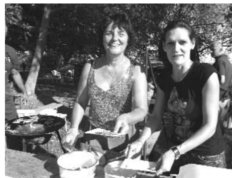
Főznek a „közönség kedvencei”...