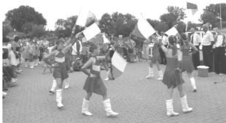
Tánc a kikötőben