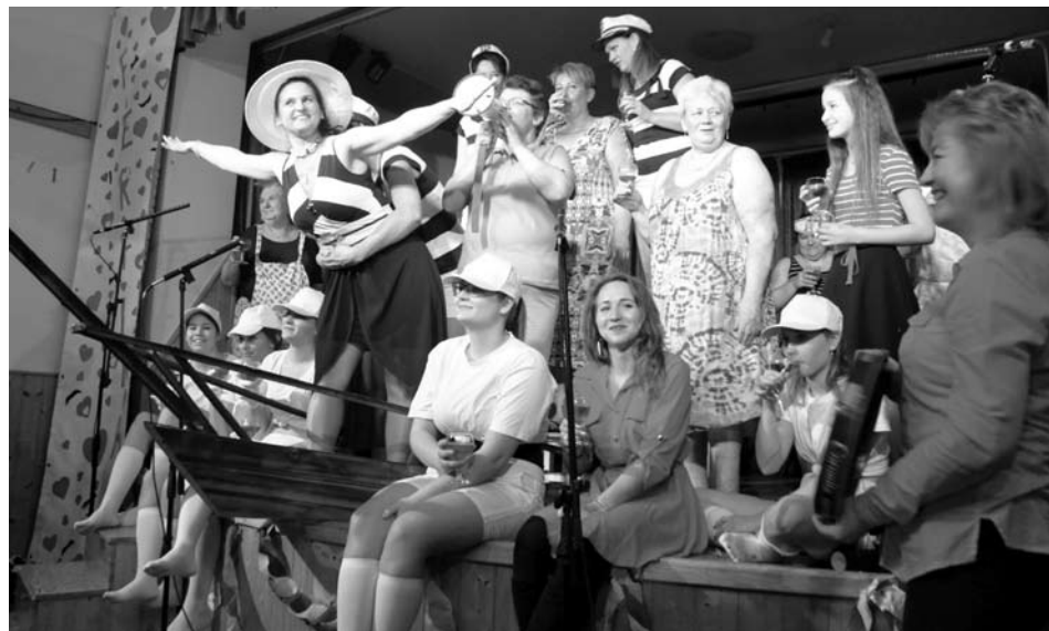
Férfinap színpadi stáb