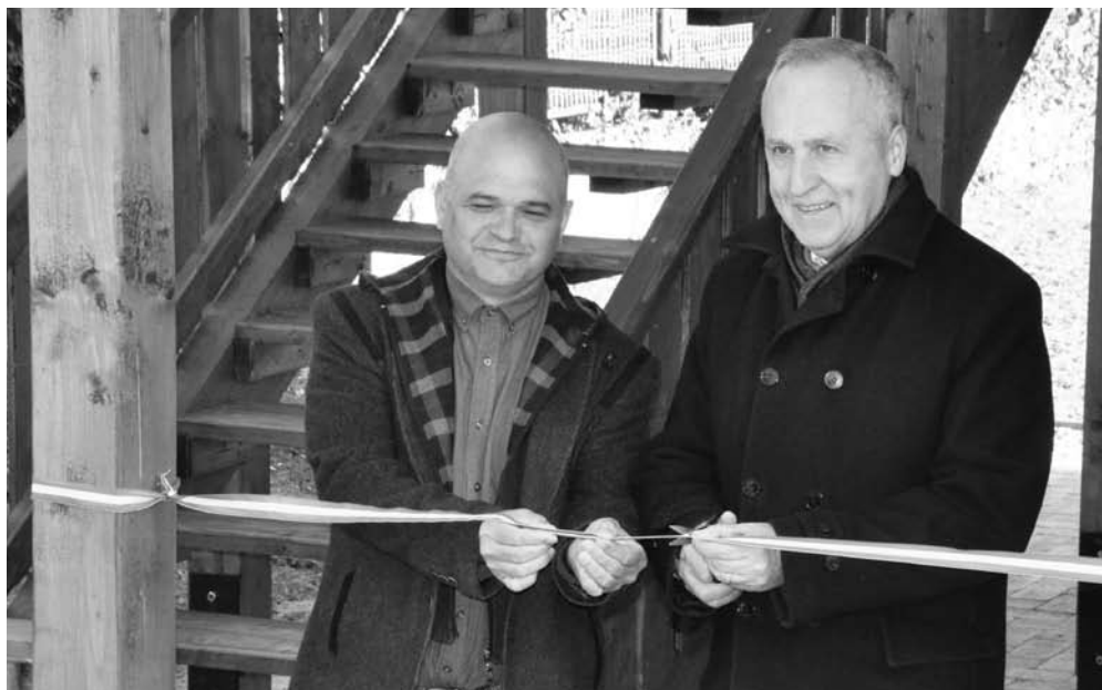
Mag-Tár-Házunk hivatalos átadója, Konrád Károly államtitkár közreműködésével