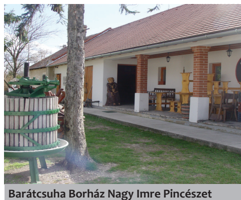
Barátcsuha Borház Nagy Imre Pincészet