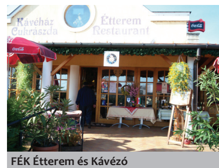
FÉK Étterem és Kávézó