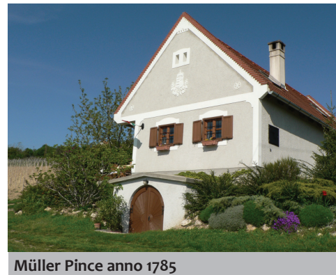
Müller Pince anno 1785