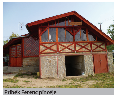
Pribék Ferenc pincéje