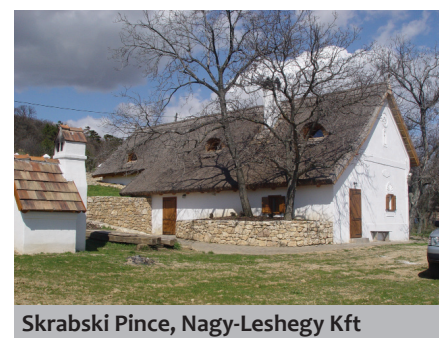
Skrabski Pince, Nagy-Leshegy Kft