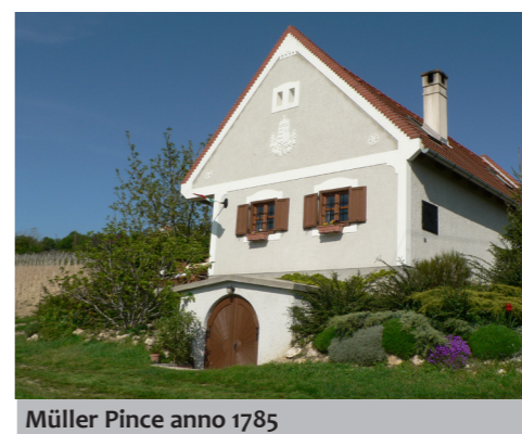
Müller Pince anno 1785