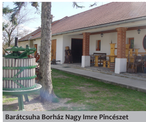
Barátcsuha Borház Nagy Imre Pincészet