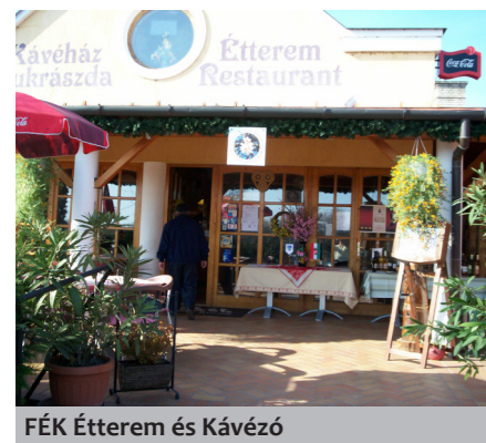
FÉK Étterem és Kávézó