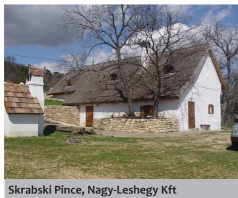
Skrabski Pince, Nagy-Leshegy Kft